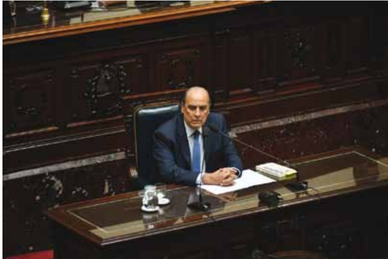
Guillermo Francos, en la Cámara de Diputados

semestre de 2024 –52,9% de pobreza, el nivel más alto de los últimos 20 años, y 18,1% de indigencia– reflejaron la irresponsabilidad e inoperancia de la gestión anterior”, afirmó.