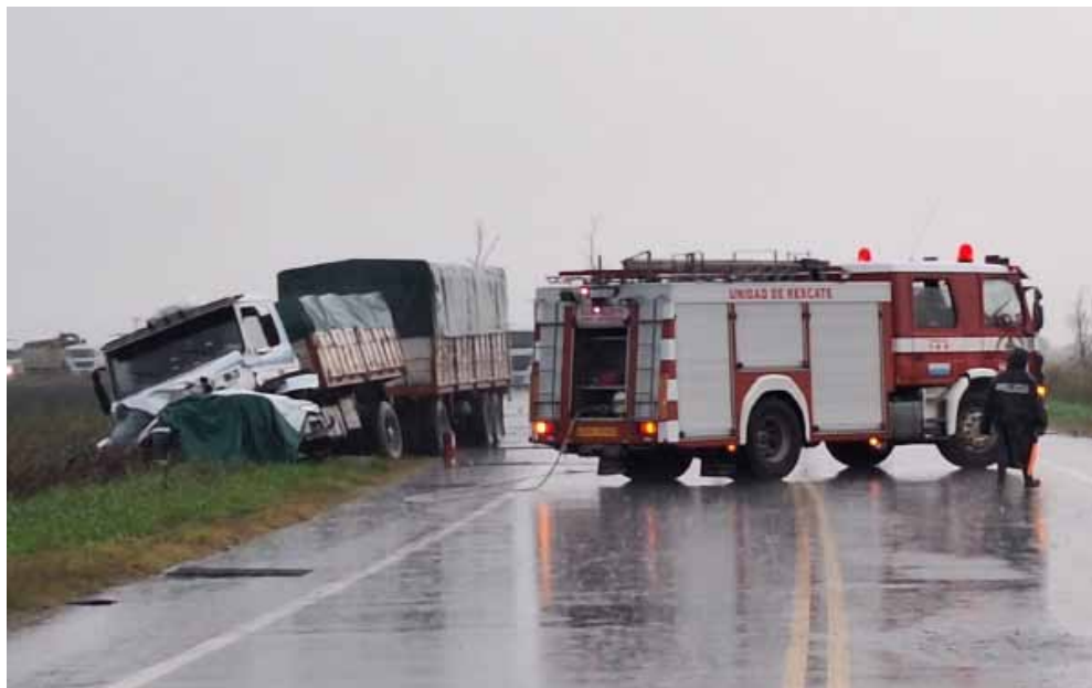
Imagen del accidente sobre la ruta 65.

quien resultó ileso. Actuaron en el lugar efectivos policiales y bomberos de Dudignac, en tanto la causa iniciada bajo la carátula de "Homicidio culposo" registra la intervención de la Ayudantía Fiscal de 9 de Julio dependiente del Departamento Judicial de Mercedes. Al cierre de esta edición se informó por parte de colegas de 9 de Julio que el tránsito continuaba restringido en el lugar. Se desconoce si a la espera aún de los peritos de la Policía Científica de Bragado o por la tarea de estos en el lugar.