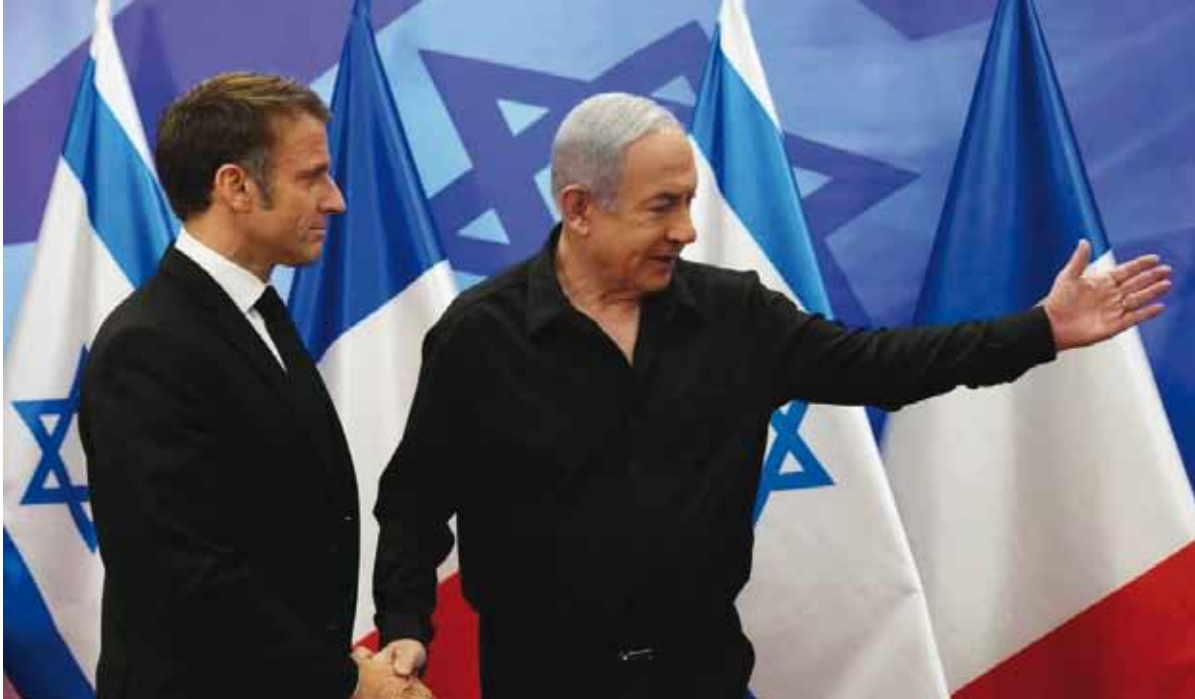
Ambos mandatarios, durante un encuentro celebrado meses atrás

Ambos mandatarios tuvieron una conversación telefónica