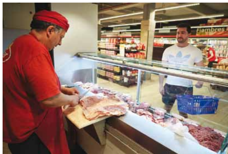
Por debajo de la inflación

Pese a la promesa de homologar solo las negociaciones salariales que se ubiquen por debajo de la inflación, índice que aseguran no volverá a repetir las cifras de marzo y potencialmente la de abril, desde la mesa chica del presidente Javier Milei confiesan el deseo de volver a reestablecer el canal de diálogo con los referentes sindicales. “Hay un montón de temas que discutir con los gremios”, plantearon. En la misma sintonía, desde el Ministerio de Capital Humano detallaron que la evolución del salario promedio en dólares, según la cotización del dólar de libre disponibilidad para las personas físicas, desde diciembre 2023, registró “un aumento de los salarios del 111,9% si se toma la cotización del promedio mensual y del 118,9% si se toma la cotización al último día hábil del mes”.