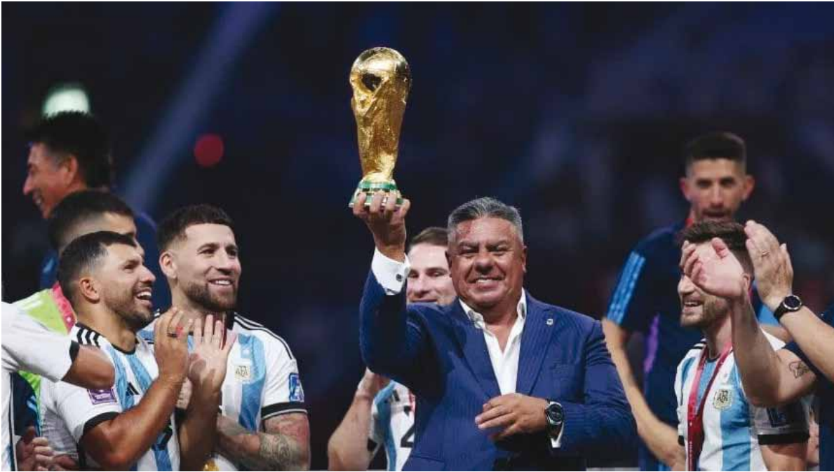
El presidente de la AFA y su confianza de cara al próximo mundial 2026

El presidente de la AFA agregó que “sería una manera de demostrarle al mundo” lo que los argentinos logran cuando tienen un propósito