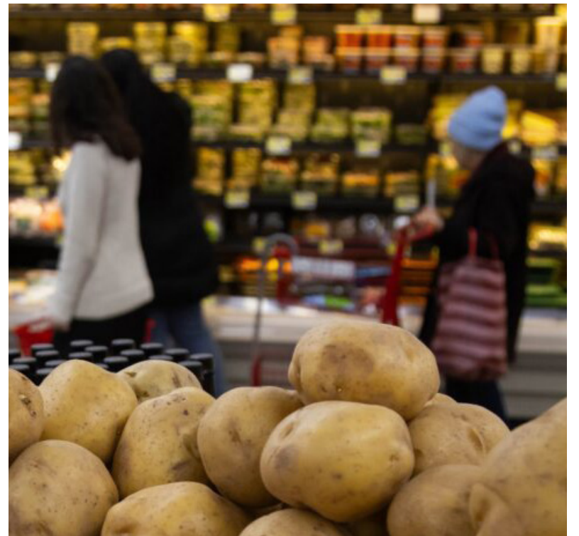
Personas en un supermercado

Habrà que ver, de todas formas, qué pasa con el consumo en las próximas semanas y cómo impacta el fin del cepo al dólar y la implementación de las bandas de flotación, con el dólar oficial por ahora ubicado en torno a los $1.200, un salto que se traducirá en una aceleración del índice de inflación. Según indicaron desde algunos supermercados, las listas empezaron a llegar con aumentos que van del 5% al 10% en aceites, harinas, productos de limpieza e higiene personal, entre otros bienes de primera necesidad. (DIB)