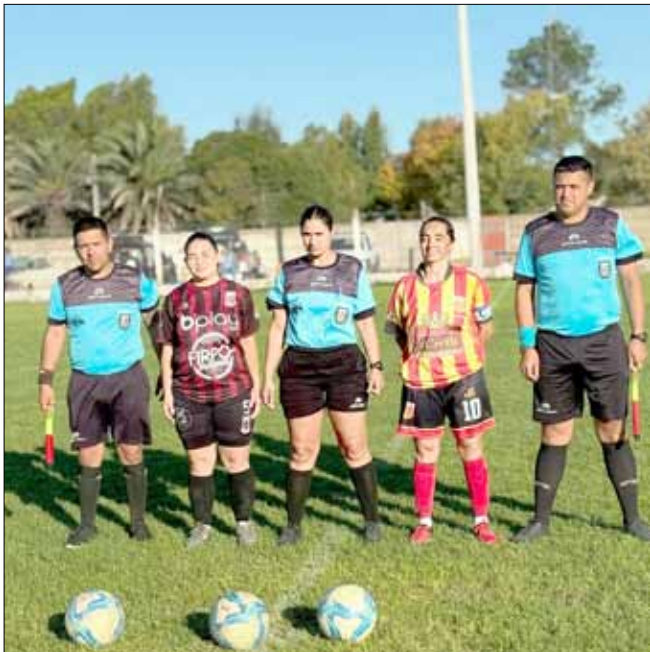
Capitanas y árbitros del choque entre Bull Dog y Balonpié.