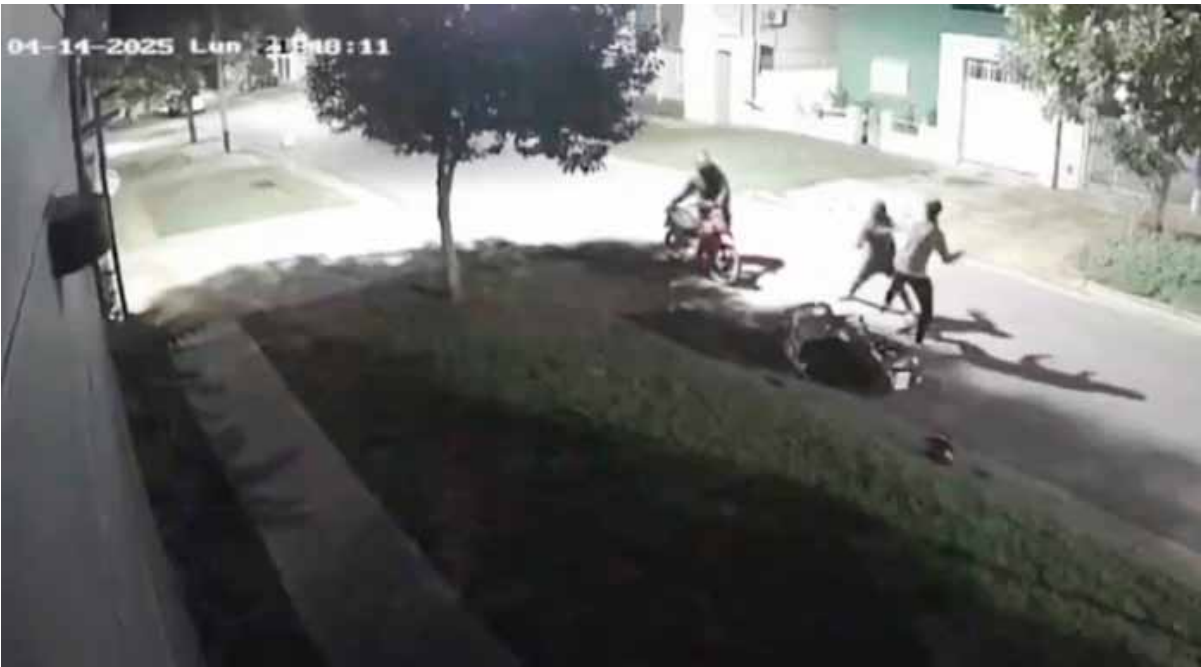
Captura de imagen del video del robo tomado por cámaras de seguridad

La secuencia de un robo ocurrido en la localidad platense de Los Hornos fue captada por cámaras de seguridad y el video impacta por la violencia y la saña de los ladrones. En las imágenes se ve cómo dos delincuentes interceptaron a un hombre que iba en moto y, en un forcejeo, tras caer al piso, uno de los sujetos le dio al menos 20 golpes con un fierro.