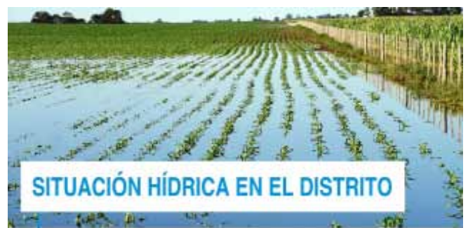
SITUACIÓN HÍDRICA EN EL DISTRITO

del distrito. Se recomienda: 1. No demorar las cosechas. 2. Almacenar los granos en zonas altas. 3. Si se prevé que la inundación dificultará la extracción de los granos del campo, sacarlos antes de que esto suceda.