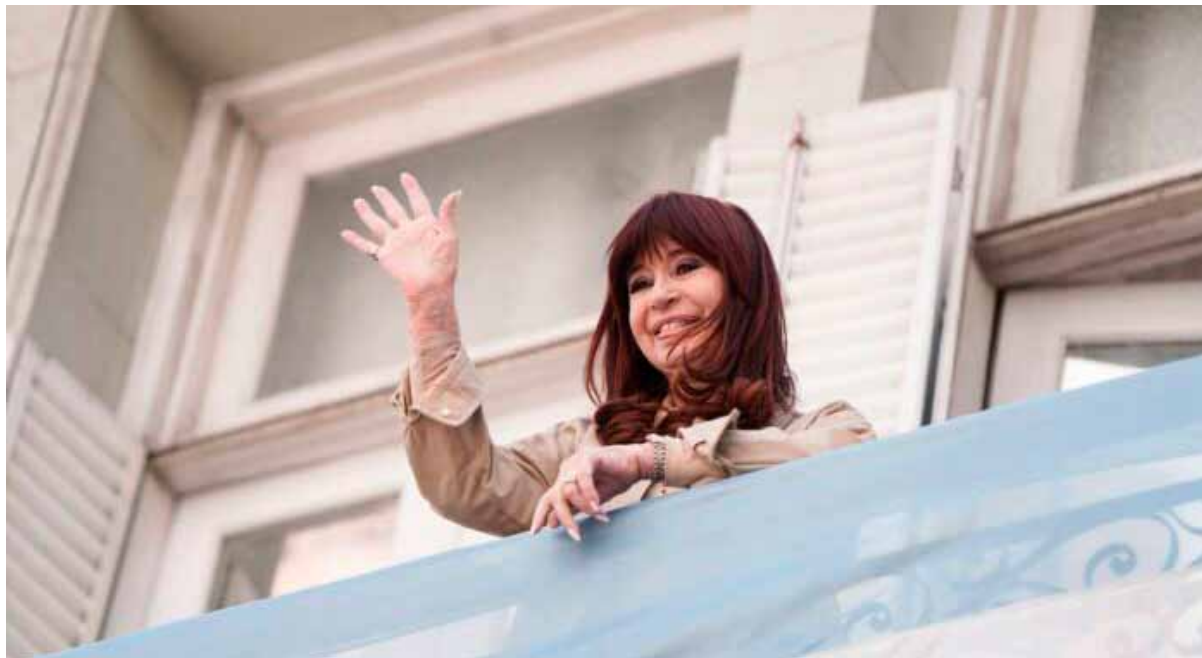
Cristina Fernández en el Instituto Patria tras conocerse la confirmación de su condena

Deberá pronunciarse sobre el pedido del fiscal, que planteó ampliar a 12 años la condena